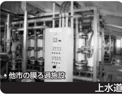
・他市の膜ろ過施設

南北幹線道路〔道路改良工事中です。〕 ダム対岸道路〔安富ダム(皆河)の対岸道路の防災工事です。〕その他道路舗装・補修工事、道路防災工事、橋梁維持補修工事。 合計約2億円