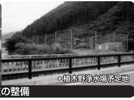
・植木野浄水場予定地

飲料水兼用耐震性貯水槽設置 安富地域事務所西側駐車場の地下に設置。災害時に飲料水として利用します。 約5,500万円